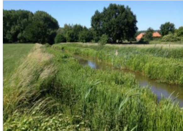
Stroombaanmaaien in de Lage Raam