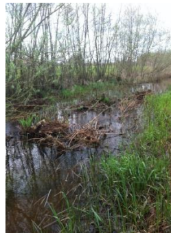
Beekhout in de Ramsbeek