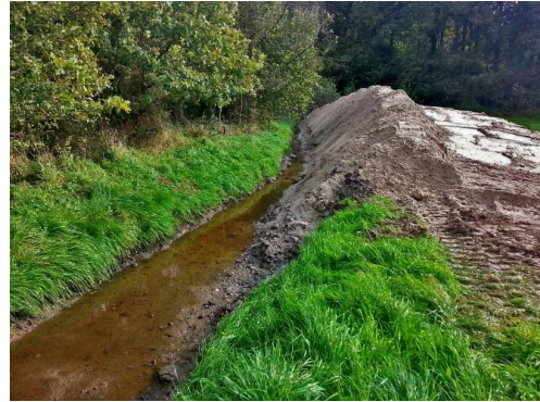
Zandsuppletie in de Snoeyinksbeek