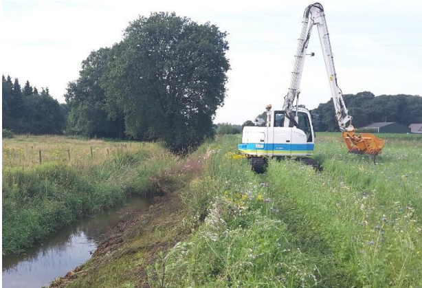
Proef met éénzijdig maaien in de Oude Leij