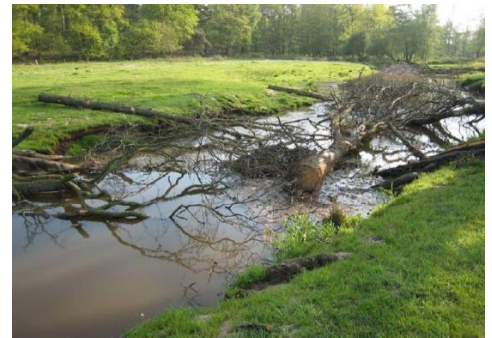
Beekhout in de Tungalroyse Beek