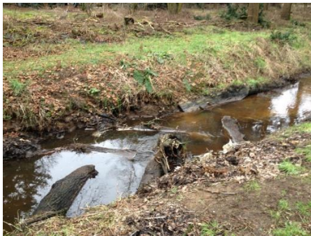
Beekhout in de Snelle Loop in 2013