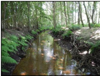
De Bijloop, ruim 25 jaar na aanleg van de beplanting