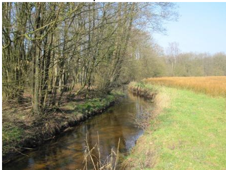
Eénzijdige beschaduwing bij de Leuvenumse beek