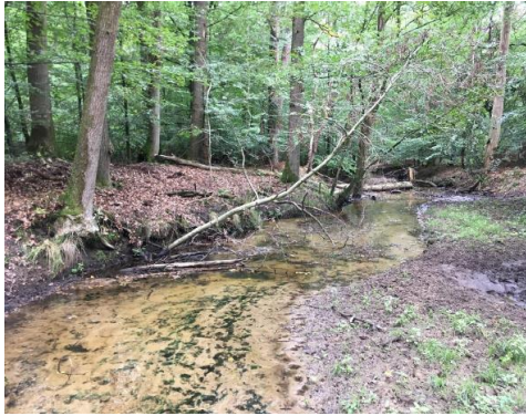
Zandsuppletie in de Hierdense beek, 4 jaar na de eerste suppletie